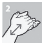
Handpalmen tegen elkaar