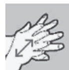
Handpalmen tegen handrug