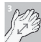
Na 30 seconden droogwrijven

Bij stap 2: Gedurende 30 seconden blijven herhalen en handen nat houden met handalcohol