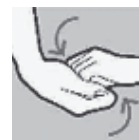
Vingers in de handpalm