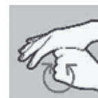
Om de duim draaien