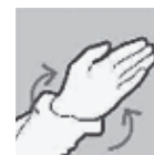
Om de polsen draaien