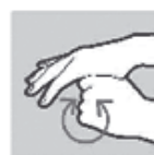
Om de duim draaien