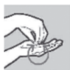
In de handpalm draaien