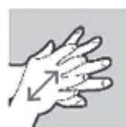
Handpalmen tegen handrug