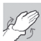
Om de polsen draaien