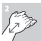
Handpalmen tegen elkaar